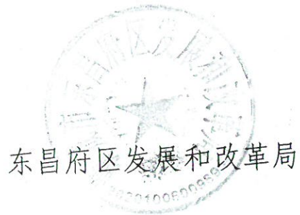
东昌府区发展和改革委员会