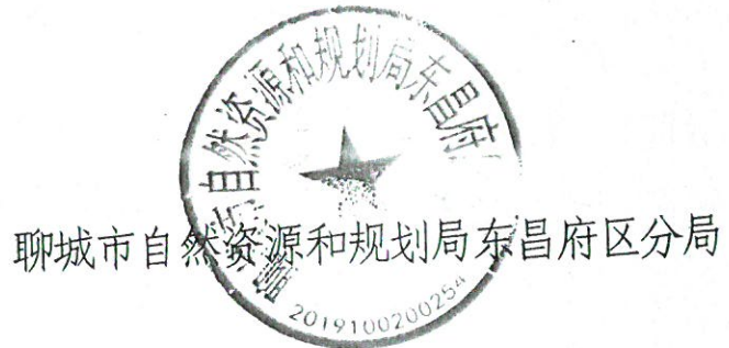
聊城市自然资源和规划局东昌府区分局