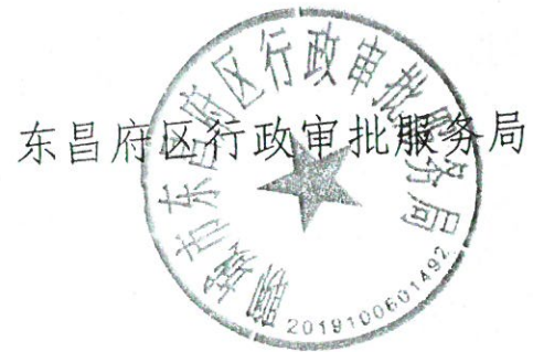
东昌府区行政审批服务局