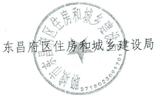
东昌府区住房和城乡建设局