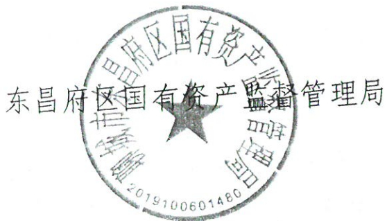
东昌府区国有资产监督管理局