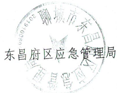
东昌府区应急管理局