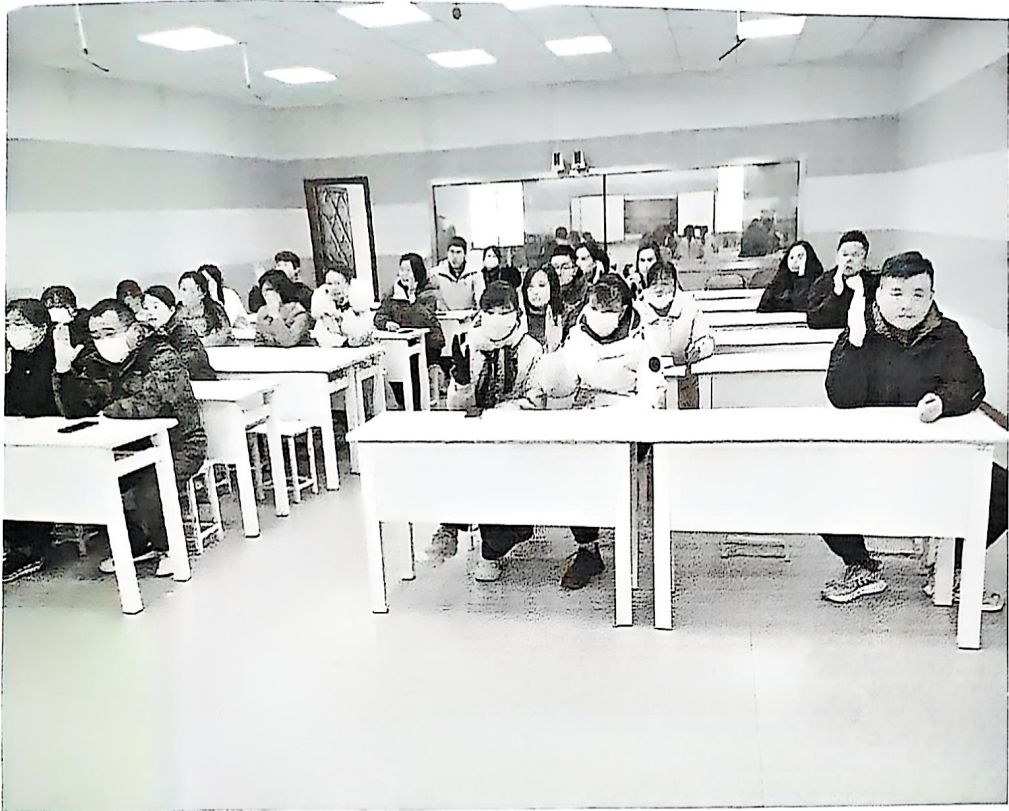
家委会成员全体表决全部同意校服招标事宜