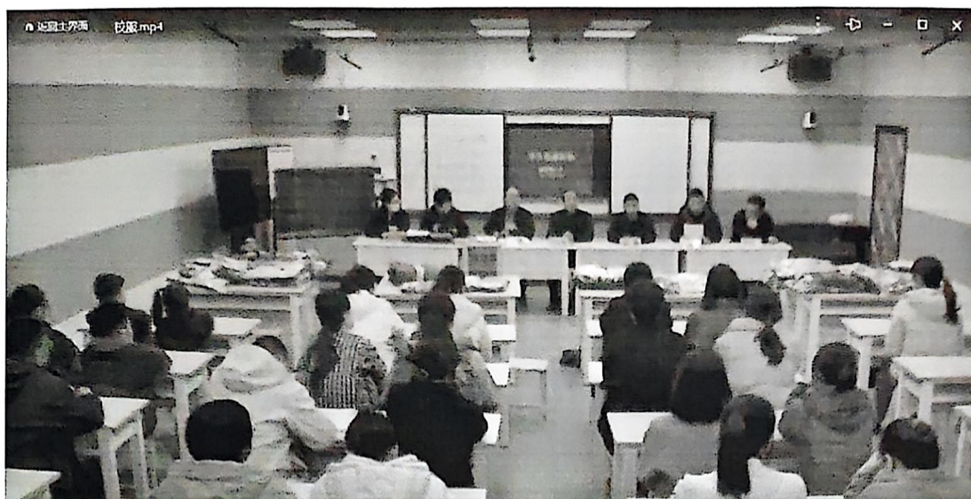
校服招标会 公证处、局纪委、局后勤、社会监督员、家长及教师代表、学生代表