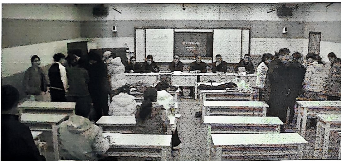
家长、教师、学生选择样衣